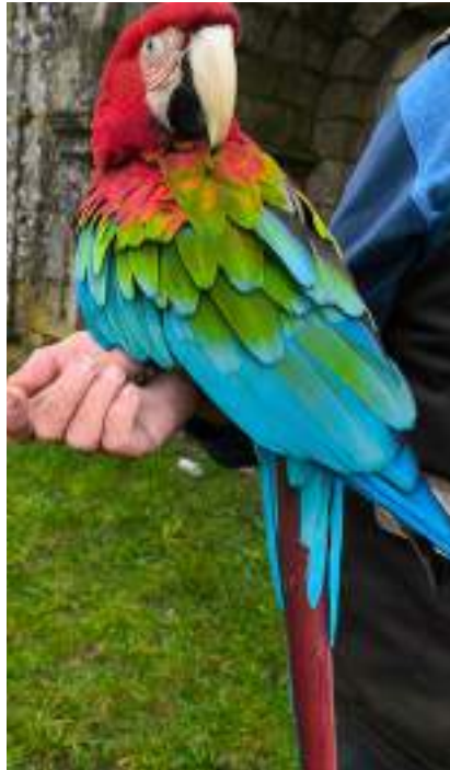
Este papagaio foi o protagonista do día

O percorrido, saíndo da Xunqueira, en Redondela, discorreu polo Camiño de Santiago para afrontar a primeira subida á ermida da Peneda que ofrece unhas vistas espectaculares da enseada de San Simón, Rande e toda a Ría de Vigo así como os montes de Soutomaior. A primeira sorpresa foi ver pousada nunha árbore unha especie de ave exótica, un papagaio que resultou ser a mascota dun paisano que explicou que a tiña que sacar a voar como se fai cos animais de compañía ademais de ilustrar aos pedalisas con todo tipo de detalles sobre a vida e costumes destas aves.